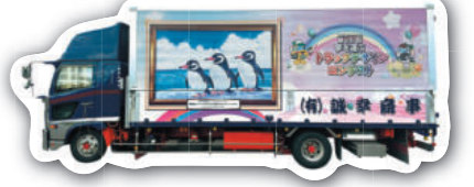
協力:(有)誠幸商事様