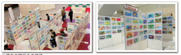
※過去の展示会の様子

入賞・入選作品(500点)が展示されます。 期間：2026年9月19日(土)・20日(日) 9月20日(日) 表彰式を開催予定 会場：横浜新都市プラザ(横浜そごう地下二階正面入口前)