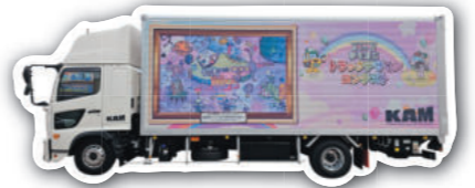
協力:神奈川県エアメッセンジャー(株)様