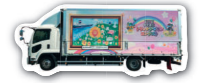
協力:(有)ネクストワン様