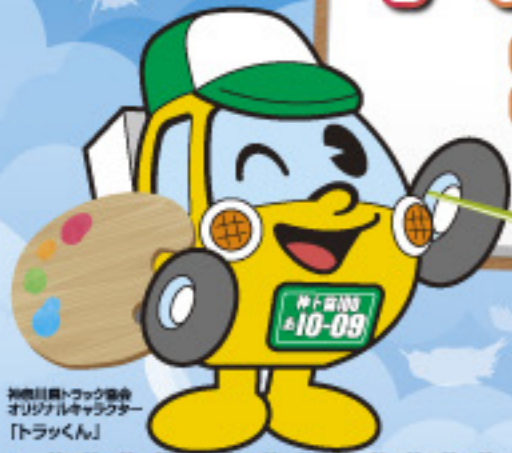
神奈川県トラック協会 オリジナルキャラクター 「トラックくん」