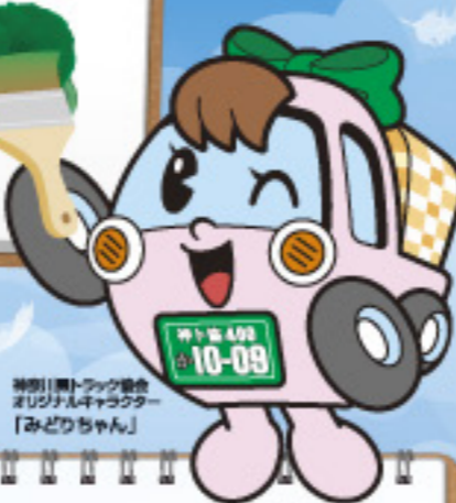
神奈川県トラック協会 オリジナルキャラクター 「みどりちゃん」