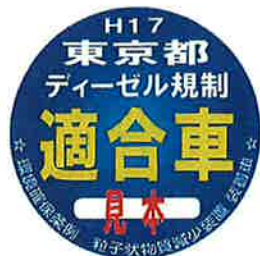
九都県市指定 粒子状物質減少装置ステッカー