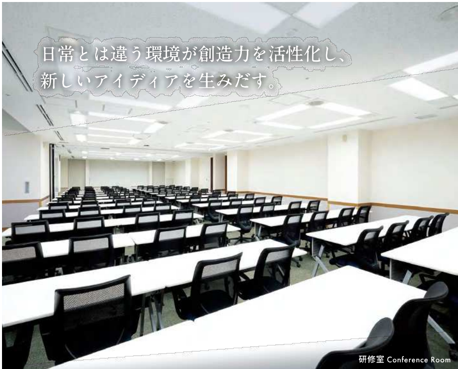
研修室 Conference Room