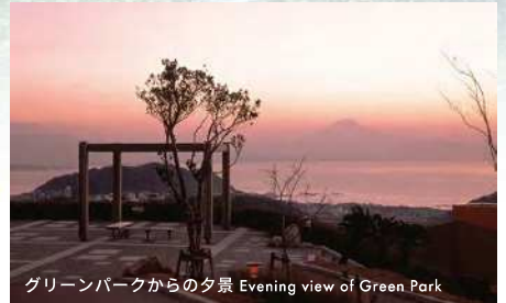
グリーンパークからの夕景 Evening view of Green Park