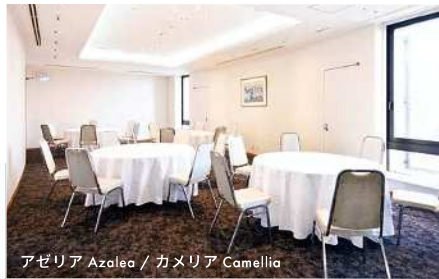
アゼリア Azalea / カメリア Camellia