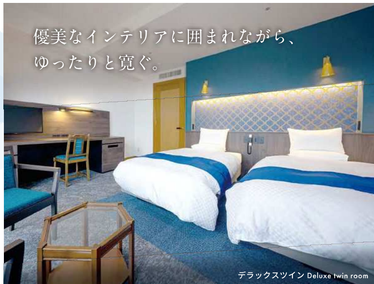
デラックスツイン Deluxe twin room