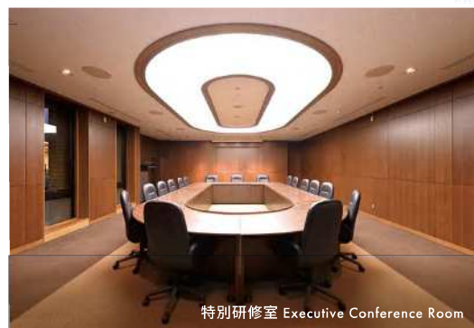
特別研修室 Executive Conference Room