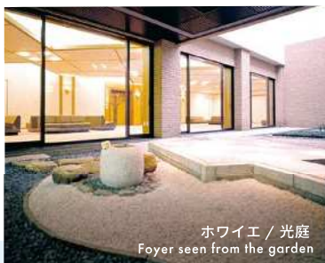
ホワイエ / 光庭 Foyer seen from the garden