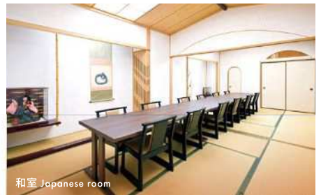
和室 Japanese room