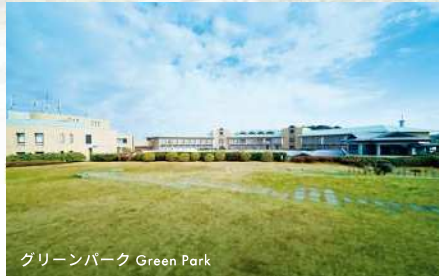
グリーンパーク Green Park