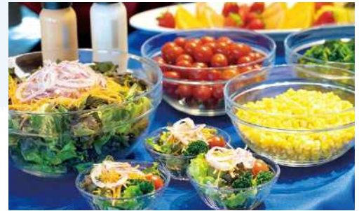
※ 写真はイメージです。