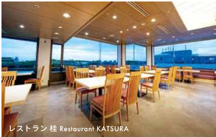
レストラン 桂 Restaurant KATSURA