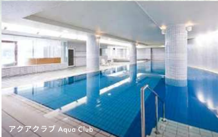
アクアクラブ Aqua Club