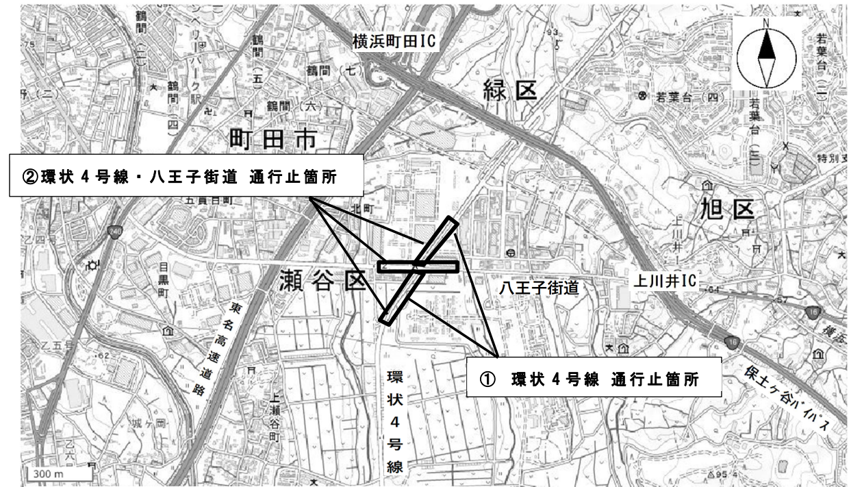
※ 電子地形図（国土地理院）を加工して作成