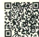
ガイドラインのポイント

交通労働災害の防止を図るための指針として、 安全な走行ができない可能性が高い発注の禁止等 、事業者や運転者の責務と、荷主、元請事業者等による配慮事項等を示したもの。